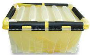
Контейнер для обеззараживания 8, 16л