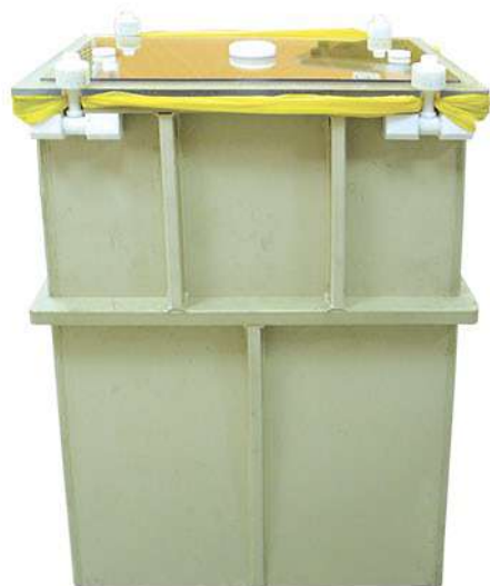
Контейнер для обеззараживания 60л