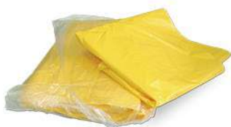
Пакеты для обеззараживания отходов