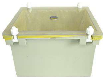
Контейнер для обеззараживания 30л