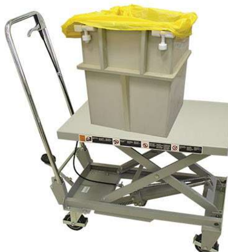
Тележка с подъемным механизмом для транспортировки контейнеров