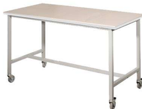
Столик для размещения установок «СТЕРИУС»